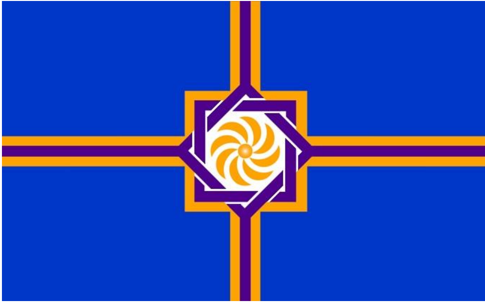
Drapeau de la République d'Arménie Occidentale (Arménie)