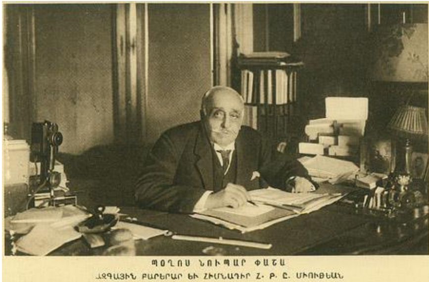
Président du Conseil National d'Arménie Occidentale Boghos Nubar Pacha