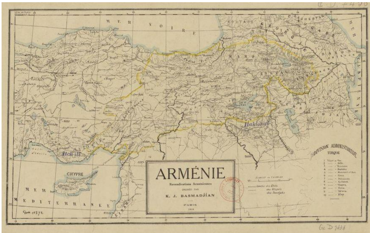
Carte ethnographique de l'Arménie