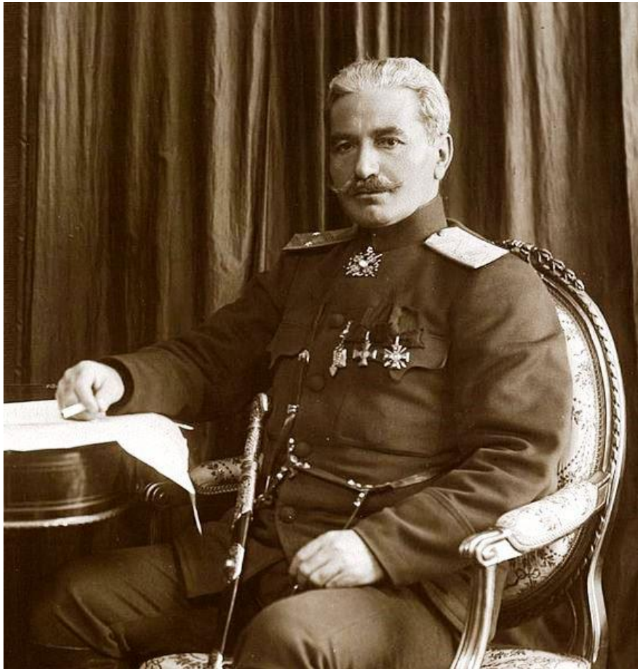
Commandant (Zoravar) Andranik