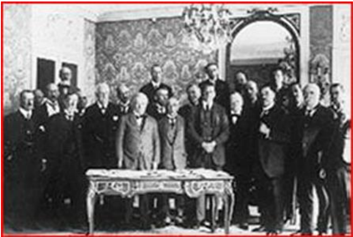
Membres participants au Traité de Paix de Sèvres