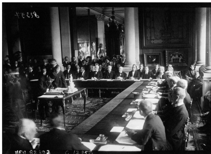
La délégation turque apposant sa signature au bas du Traité de Pais de Sèvres